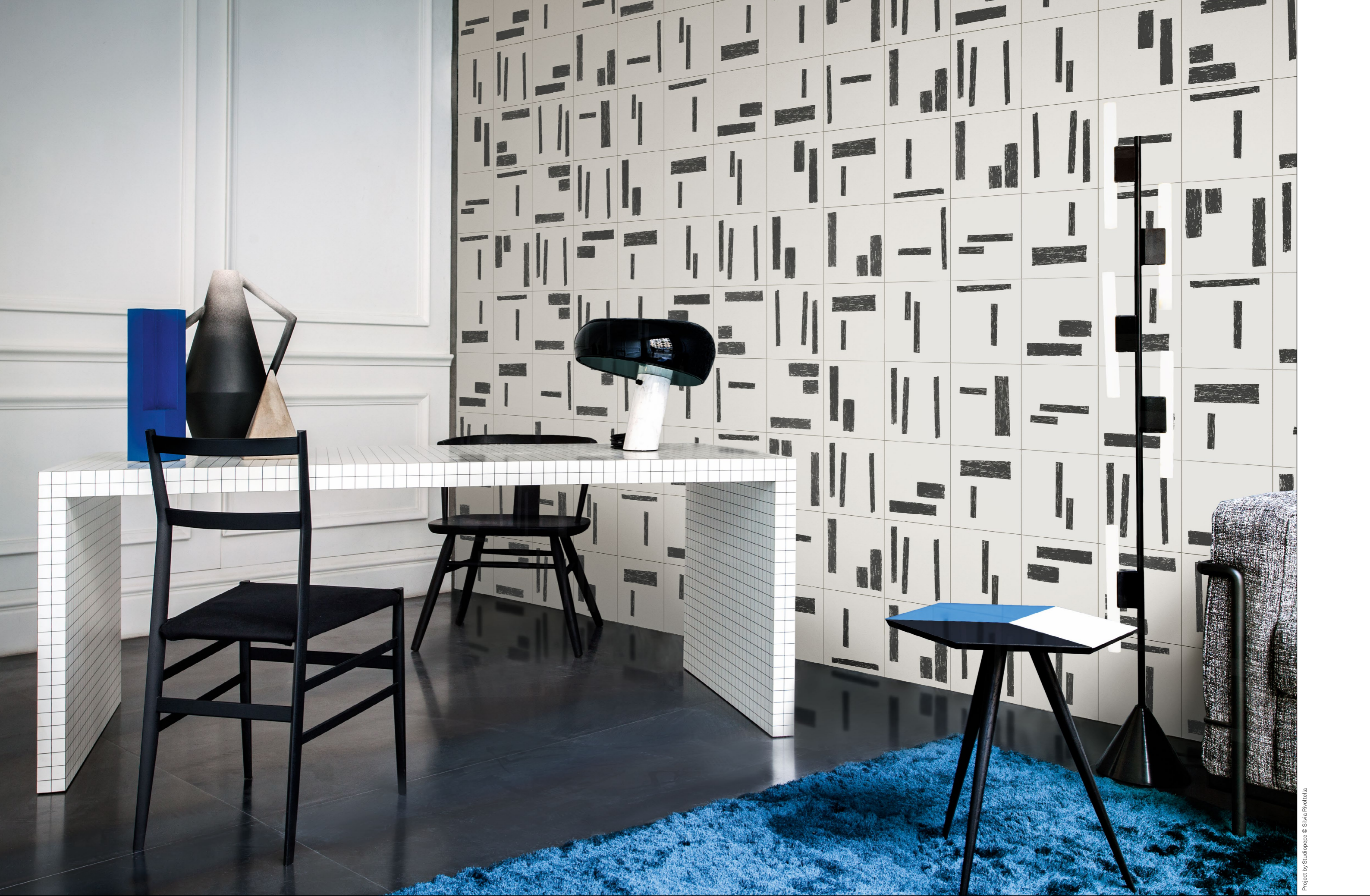
LIVING, rivestimento / covering PRIMITIVA 1 (cm. 25x25 - 10"x10")